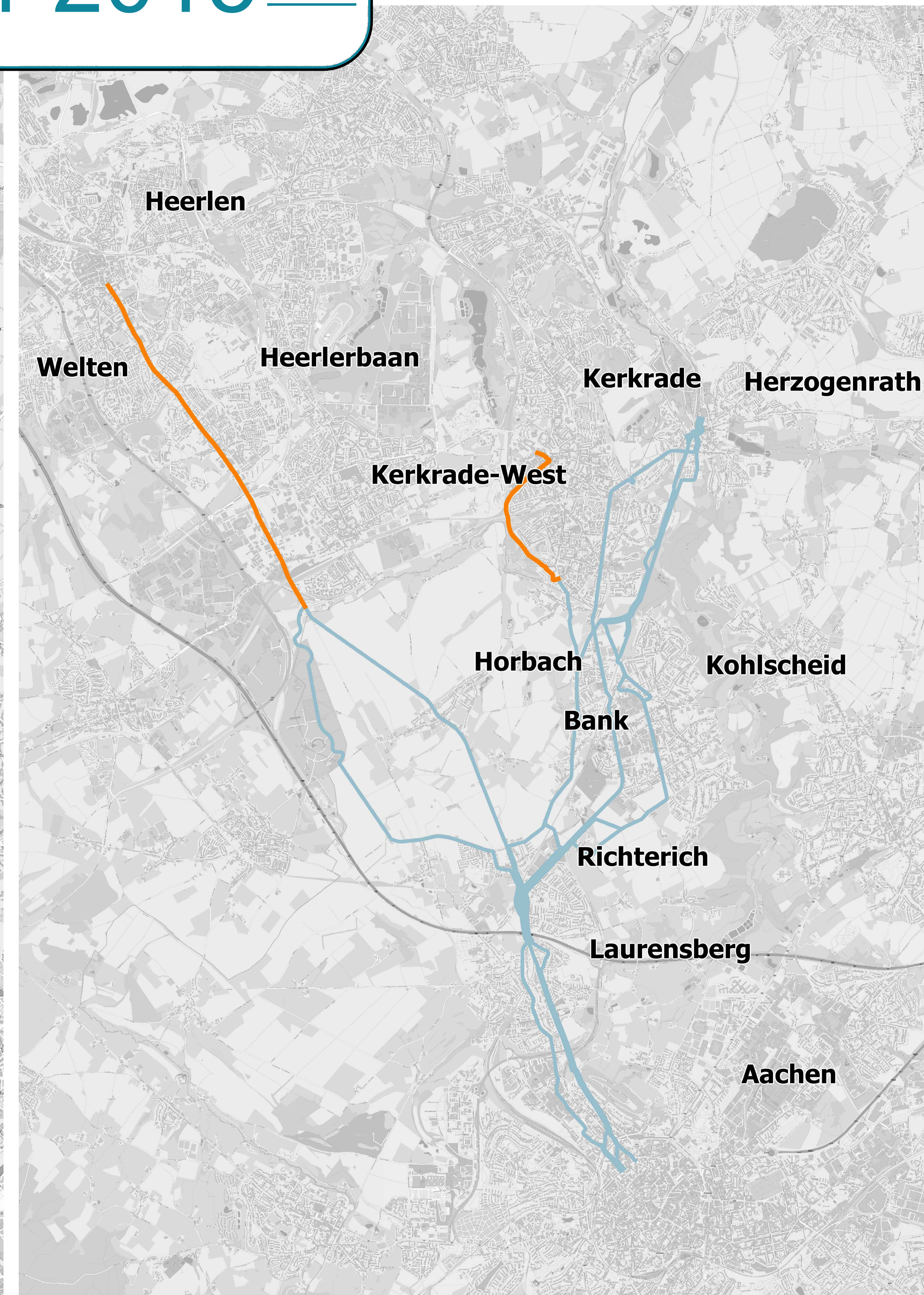
≡ Weiterführung in den Niederlanden ≡